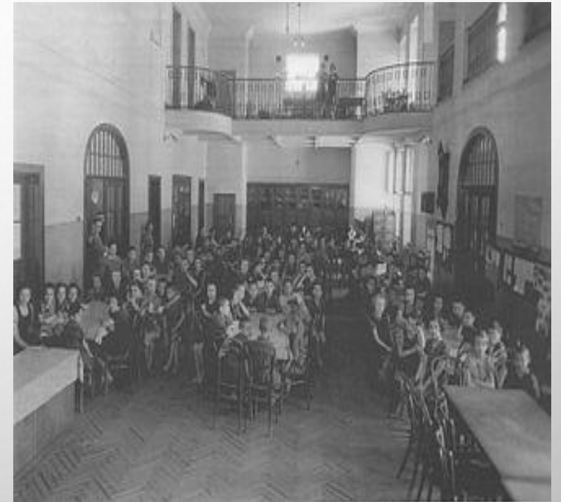
Dzieci w Domu Sierot

OD 1919 JANUSZ KORCZAK WSPÓŁTWORZYŁ TAKŻE DRUGĄ INSTYTUCJĘ, DLA DZIECI POLSKICH: ZAKŁAD WYCHOWAWCZY „NASZ DOM” W PRUSZKOWIE. OBA DOMY, PRZEZNACZONE BYŁY DLA DZIECI W WIEKU 7–14 LAT.